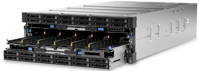
上下计算托架可从机箱前面滑出，便于升级和维护。

横向扩展系统这一要求比从前任何时候都容易满足。SR950 的独特模块化设计让一切尽在掌握，对可扩展性作出了重新定义。